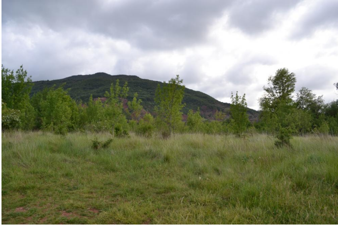
Vers les Plos, le 10/05/2017 par Jérémy Cuvelier.