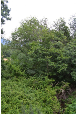
Vers Source de la Vernède, le 21/06/2017 par Jérémie Cuvelier.