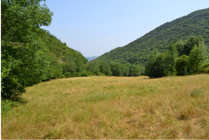
Ripisylve continue vers les Valettes, le 21/06/2017 par Jérémy Cuvelier.