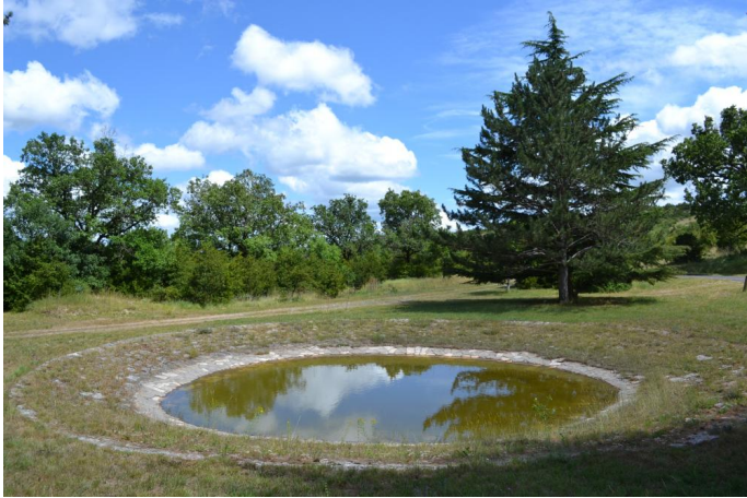
Lavogne vers les Coucelles, le 28/06/2017.