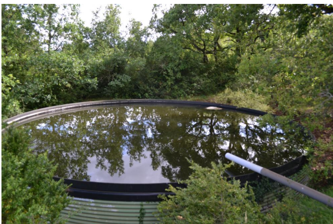
Exemple de bassin non retenu dans l'inventaire, le 28/06/2017 par Jérémy Cuvelier.