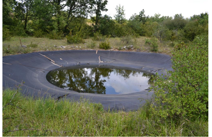
Exemple d'une lavogne bâchée non retenue dans l'inventaire, le 28/06/2017 par Jérémy Cuvelier.