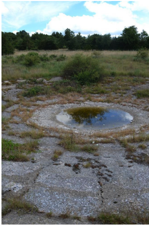
Lavogne vers le Viala, le 28/06/2017 par Jérémy Cuvelier.