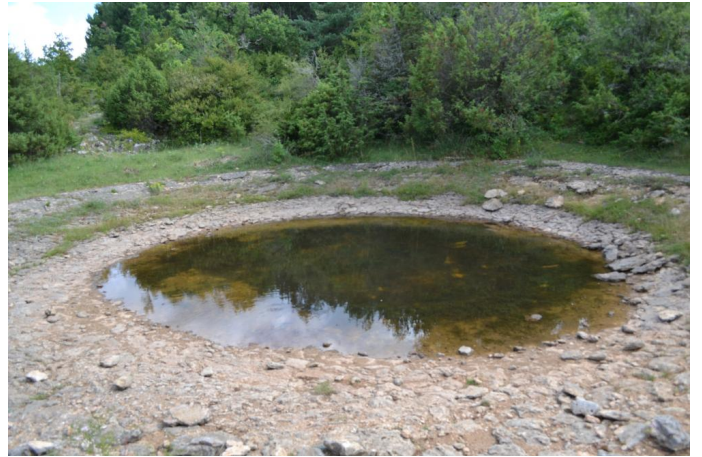
Lavogne vers Sablières, le 28/06/2017 par Jérémy Cuvelier.