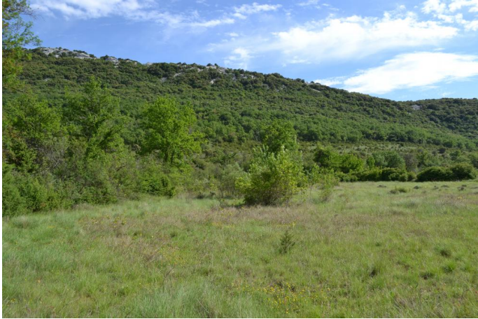
Cordon de Frênes sur cours d'eau à écoulements temporaires en amont de la retenue, le 17/05/2017.