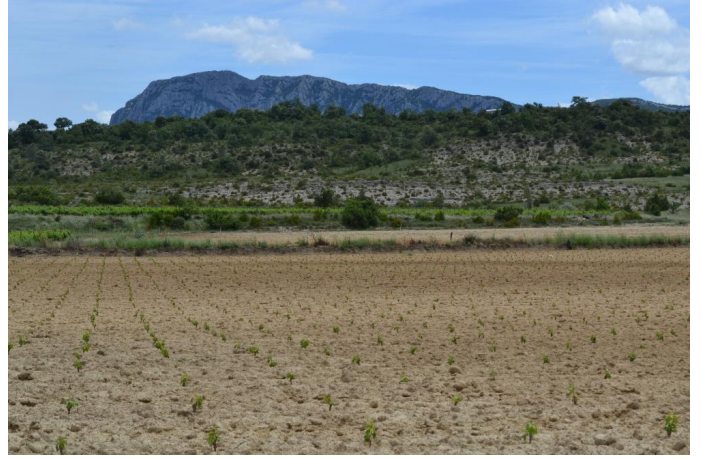
Portion de ripisylve coupée sur une centaine de mètres vers les Combes, le 06/06/2017 par Jérémy Cuvelier.