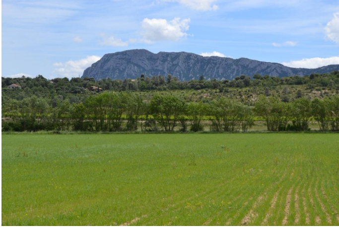
Cordon de Frênes sur cours d'eau canalisé à écoulements temporaires en contexte agricole, le 06/06/2017 par Jérémy Cuvelier.