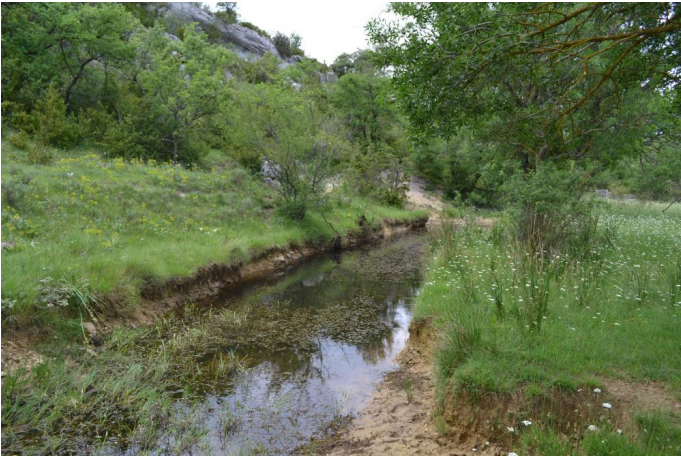
Herbier développé dans une vasque très favorable aux amphibiens et aux odonates, le 31/05/2017 par Jérémy Cuvelier.