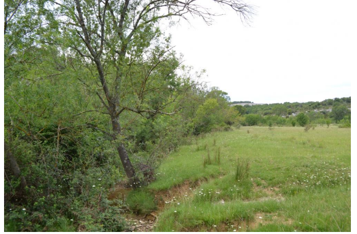
en aval D122, le 31/05/2017 par Jérémy Cuvelier.