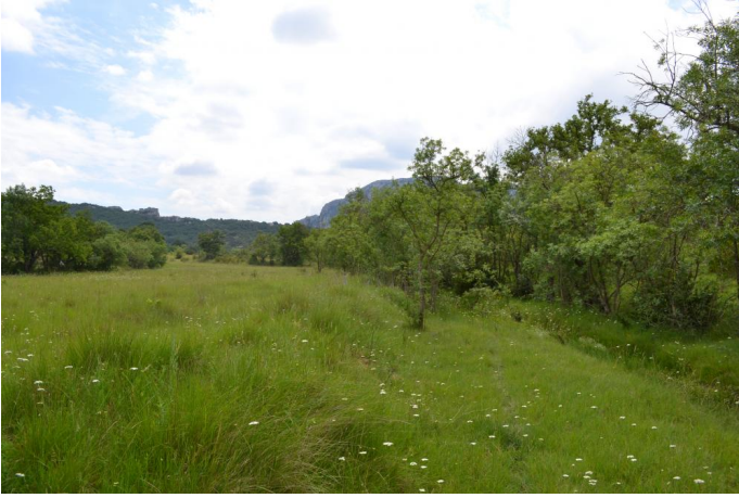
en amont D122, le 31/05/2017 par Jérémy Cuvelier.