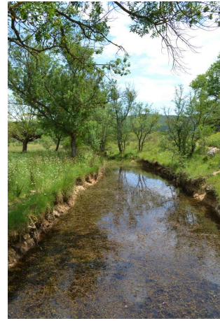
, le 31/05/2017 par Jérémy Cuvelier.