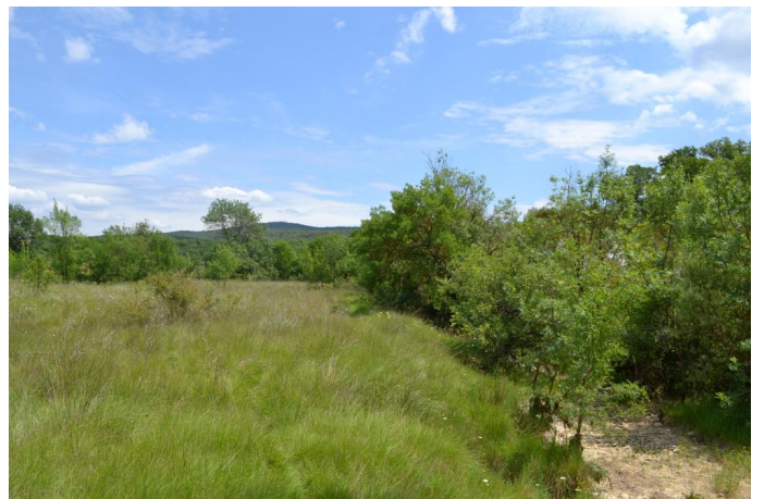
, le 31/05/2017 par Jérémy Cuvelier.