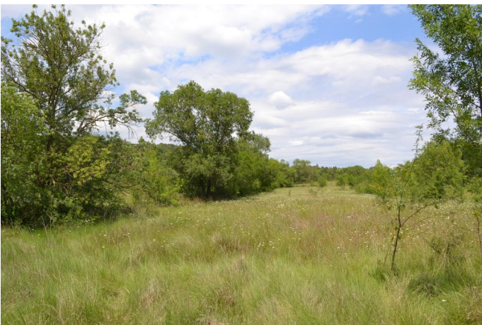
, le 31/05/2017 par Jérémy Cuvelier.