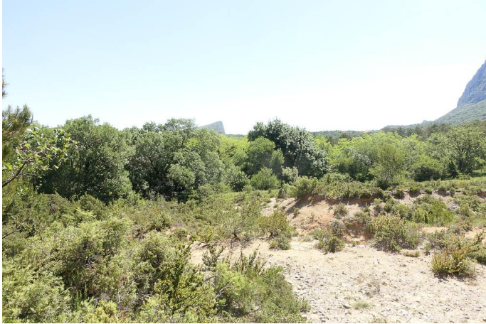
Vue du secteur amont, depuis les pâtures à l'Est., le 25/05/2017 par Jean-Laurent Hentz.