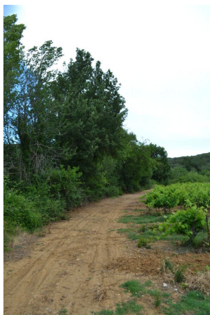
Ripisylve sur cours d'eau temporaire en contexte viticole, le 06/06/2017 par Jérémy Cuvelier.