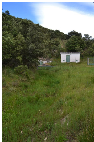
Captage en tête de bassin versant, le 06/06/2017 par Jérémy Cuvelier.