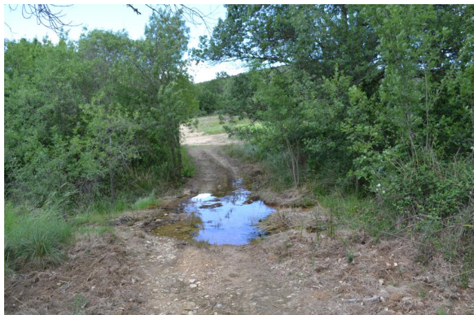
Passage à gué vers Sources des Trois Baumettes, le 06/06/2017 par Jérémy Cuvelier.