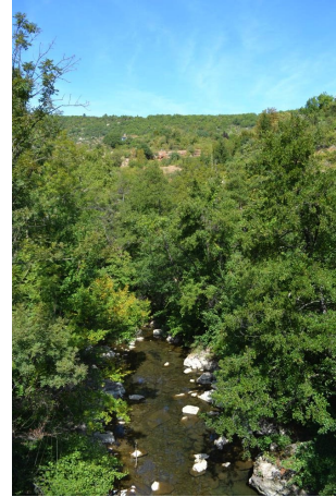
, le 07/09/2017 par Jérémy Cuvelier.