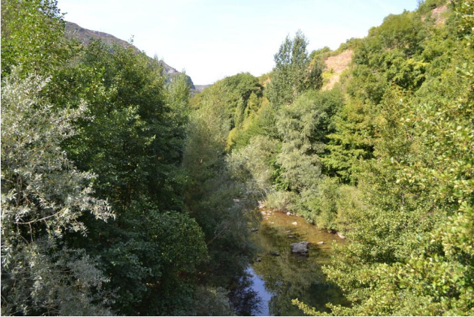
Aperçu de l'Arre et de sa ripisylve, le 07/09/2017 par Jérémy Cuvelier.