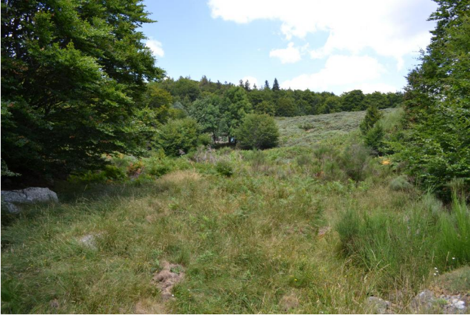
Bas-marais en cours d'enfrichement, le 03/08/2017 par Jérémy Cuvelier.