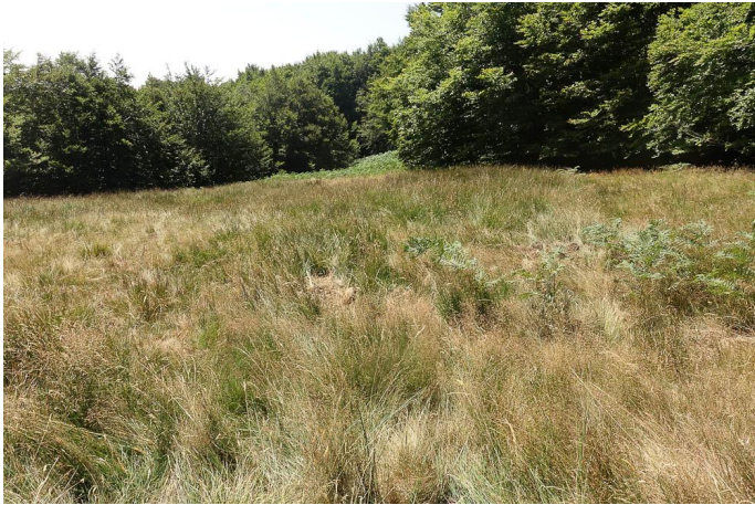
Secteur pentu à végétation des zones humides., le 03/08/2017 par Jean-Laurent Hentz.