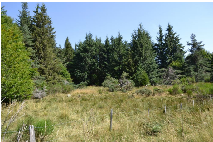
, le 03/08/2017 par Jérémy Cuvelier.