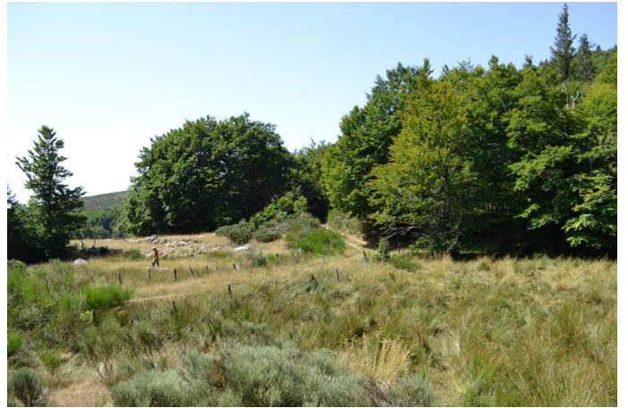
Bas-marais pâturé, le 03/08/2017.