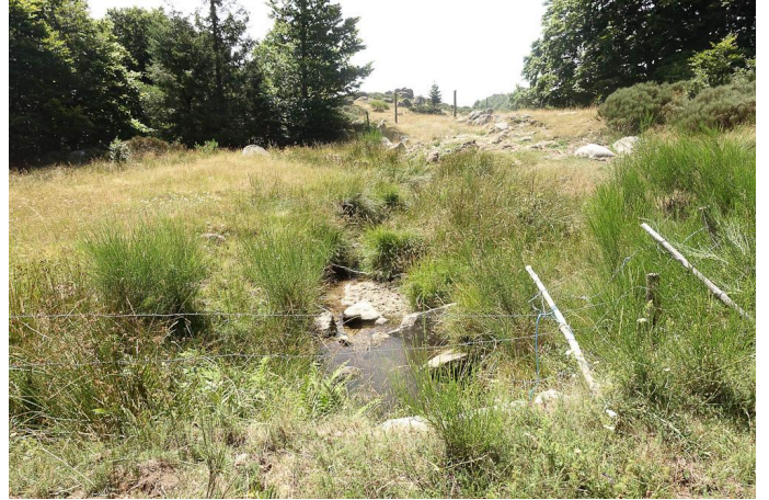
Le ruisseau du Garel et des bordures humides pâturées., le 03/08/2017 par Jean-Laurent Hentz.