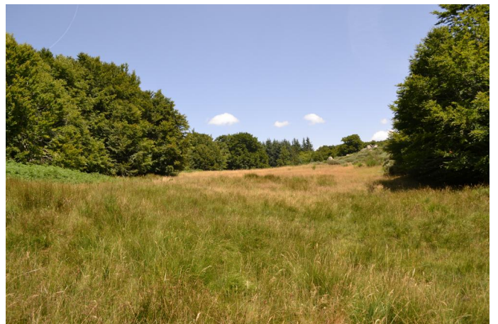
, le 03/08/2017 par Jérémy Cuvelier.