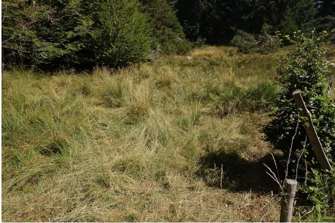
Bas-marais pâturé, près de la piste., le 03/08/2017 par Jean-Laurent Hentz.