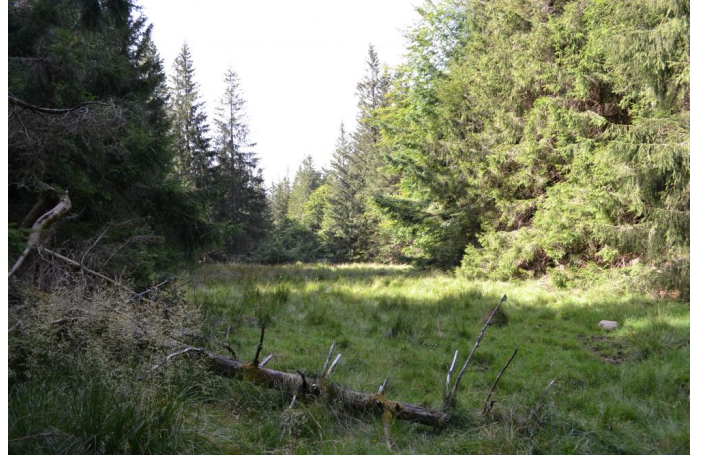
Bas-marais en contexte forestier, le 03/08/2017 par Jérémy Cuvelier.