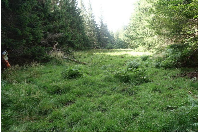
Bas-marais le plus haut., le 03/08/2017 par Jean-Laurent Hentz.