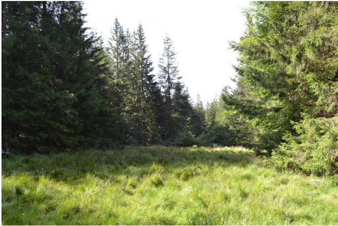
, le 03/08/2017 par Jérémy Cuvelier.