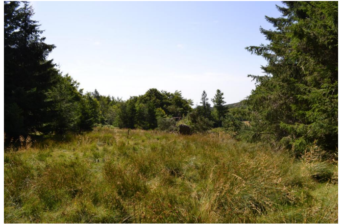
, le 03/08/2017 par Jérémy Cuvelier.