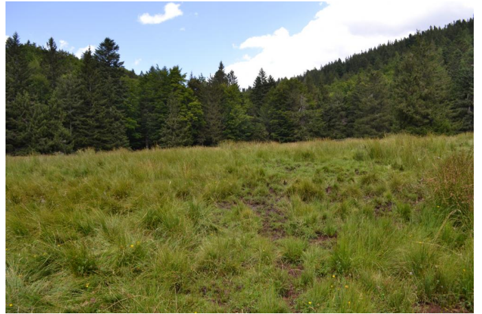
, le 03/08/2017 par Jérémy Cuvelier.