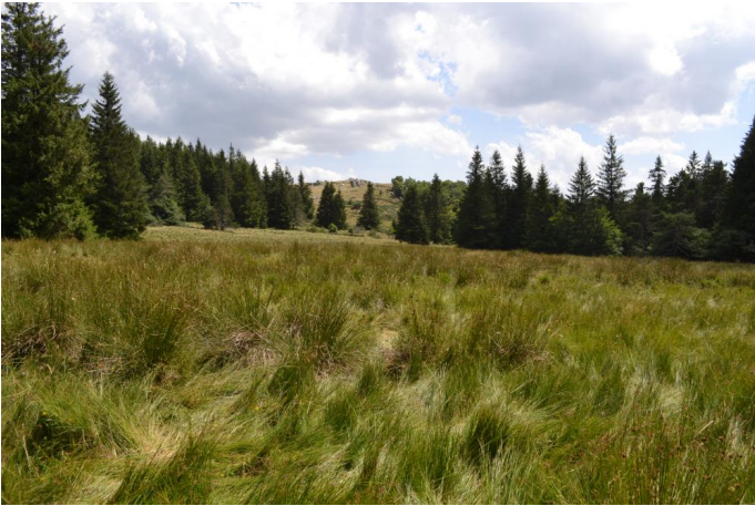
, le 03/08/2017 par Jérémy Cuvelier.