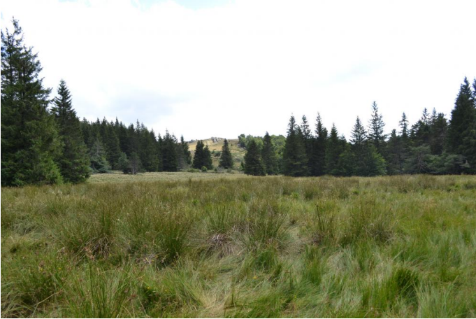
Aperçu du bas-marais, le 03/08/2017 par Jérémy Cuvelier.