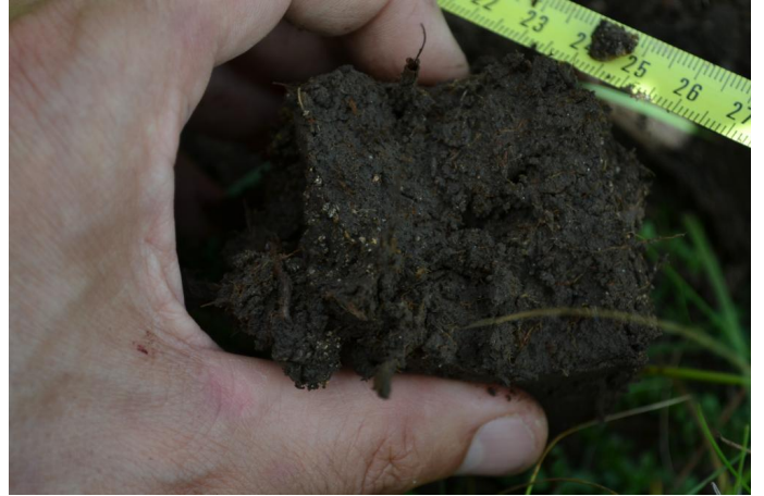
Sol para-tourbeux au niveau du bas-marais, le 03/08/2017 par Jérémy Cuvelier.