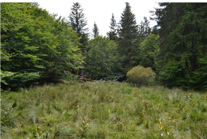
, le 03/08/2017 par Jérémy Cuvelier.