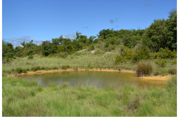
mare en contrebas de la zone humide de pente, le 06/06/2017 par Jérémy Cuvelier.