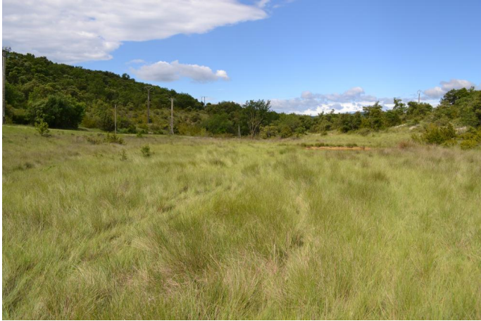
zone humide de pente colonisée par le Choin noir, le 06/06/2017 par Jérémy Cuvelier.