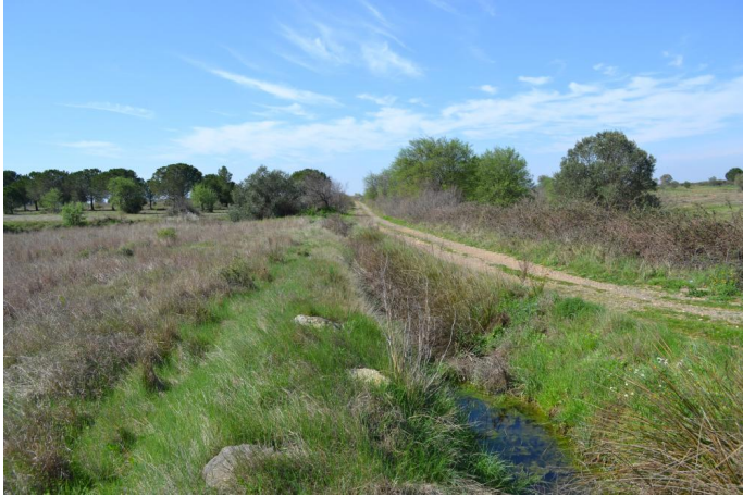
Friche post-culturelle sur sols hydromorphe (engorgement en eau à très faible profondeur), le 14/03/2017 par Jérémy Cuvelier.