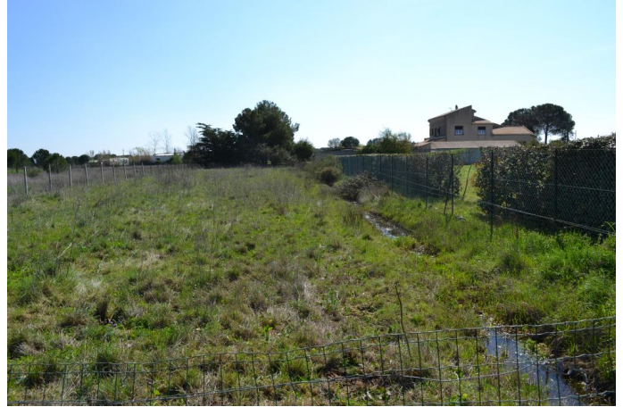
Fossé de drainage en eau, le 14/03/2017 par Jérémy Cuvelier.