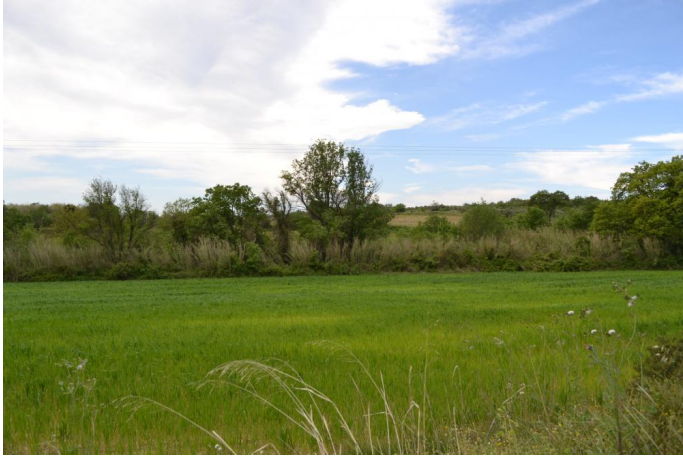
Aperçu de la ripisylve sur berges du cours d'eau canalisé en contexte agricole dominé par les Frênes et la Canne de Provence, le 11/04/2017.