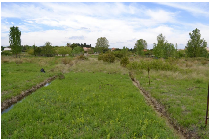
Fossé de drainage au sein de la prairie, le 11/04/2017.