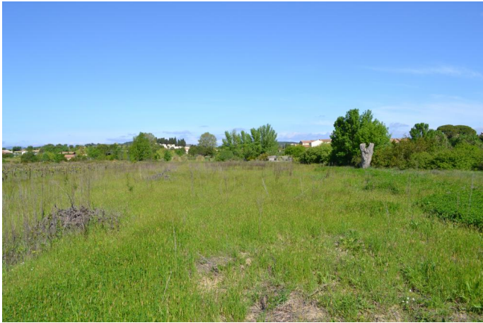
Aperçu d'une ancienne parcelle plantée en vignes au niveau des espaces hydromorphes (possibilité de restauration), le 11/04/2017.