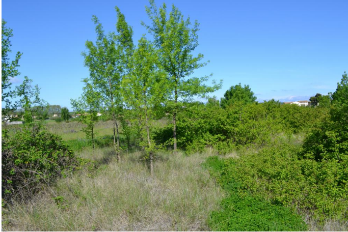
Friche agricole colonisée par des espèces végétales méso-hygrophiles sur sols hydromorphes, le 11/04/2017.