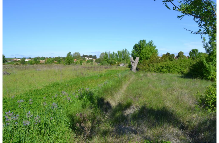
, le 11/04/2017 par Jérémy Cuvelier.