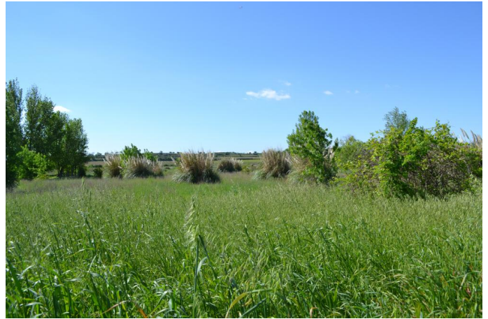
Colonisation des espaces hydromorphes par l'Herbe de la Pampa (action de restauration à prévoir), le 11/04/2017.