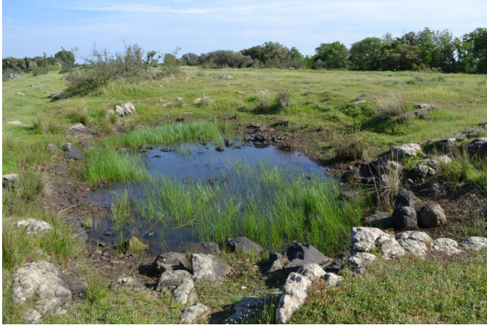
Aperçu de la mare, le 11/04/2017.