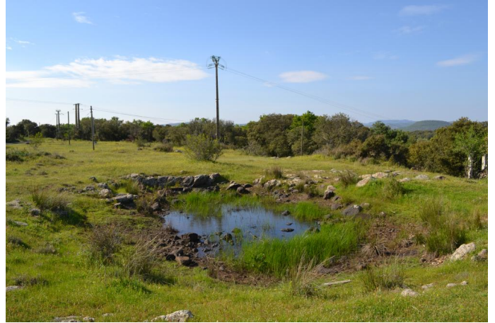
, le 17/04/2017 par Jérémy Cuvelier.