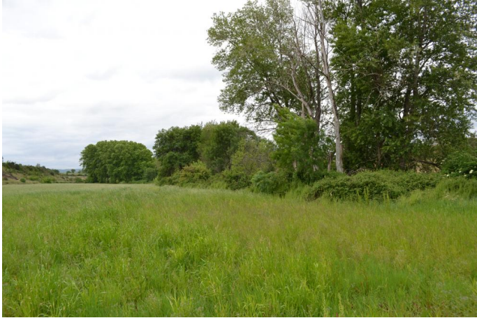
Ripisylve de Frênes, d'Aulnes et de Peupliers continue, le 10/05/2017 par Jérémy Cuvelier.