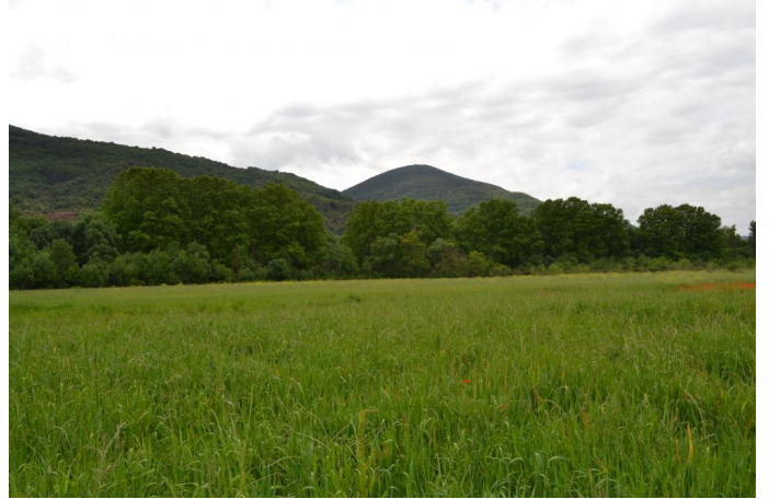
, le 10/05/2017 par Jérémy Cuvelier.