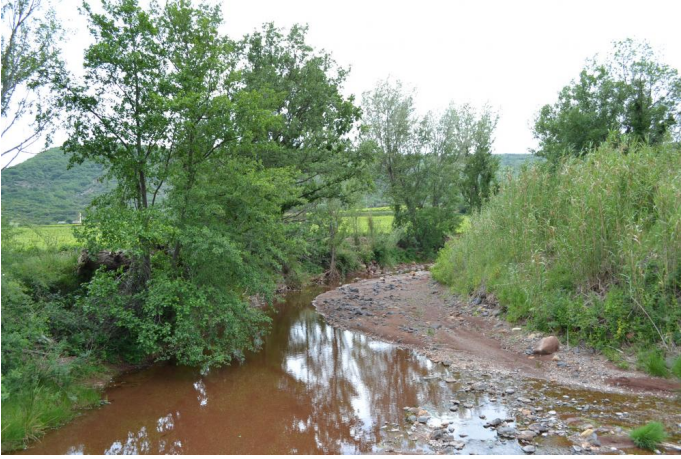
, le 10/05/2017 par Jérémy Cuvelier.