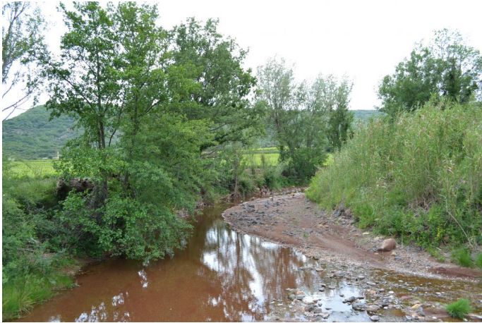
, le 10/05/2017 par Jérémy Cuvelier.