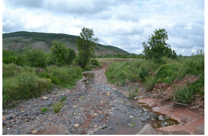
, le 10/05/2017 par Jérémy Cuvelier.