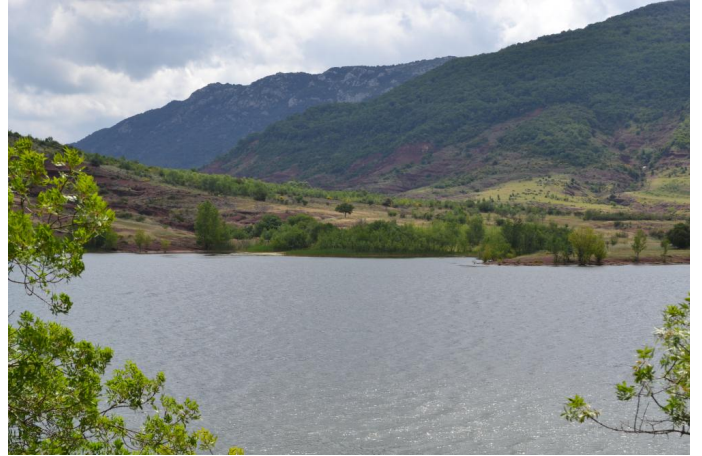
, le 10/05/2017 par Jérémy Cuvelier.