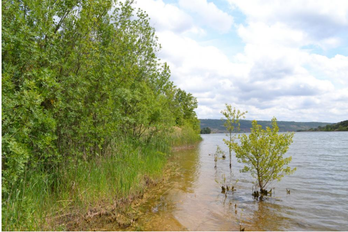
Cordon de Frênes et Peupliers sur les berges du lac, le 10/05/2017 par Jérémy Cuvelier.