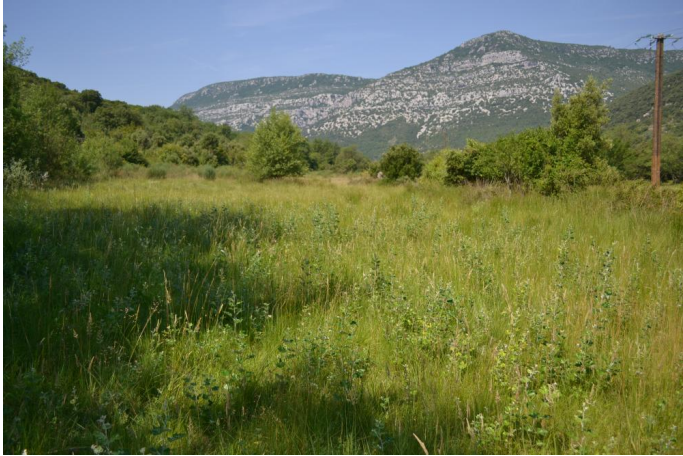
Reconquête par les Peupliers blancs, le 14/06/2017 par Jérémy Cuvelier.