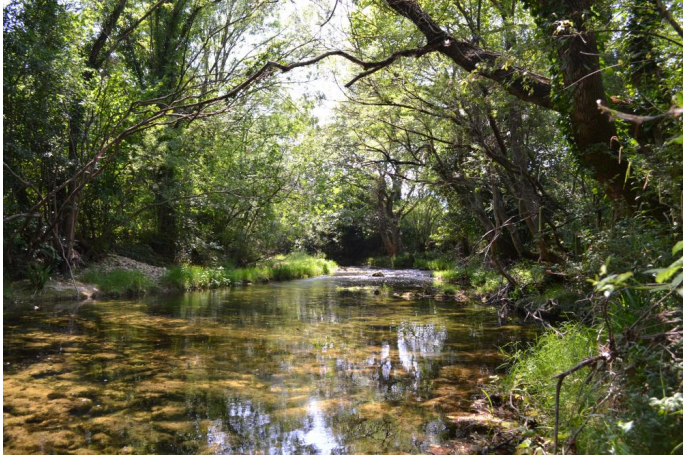
Belle ripisylve continue de Frênes et de Peupliers, le 14/06/2017.