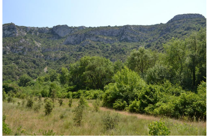
Ripisylve de Frênes et de Peupliers continue, le 14/06/2017 par Jérémy Cuvelier.