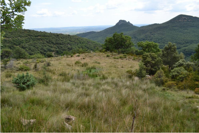
Zone humide de pente dominée par le Choin noir et le Scirpe pâturée, le 17/07/2017 par Jérémy Cuvelier.