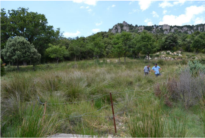
, le 17/07/2017 par Jérémy Cuvelier.