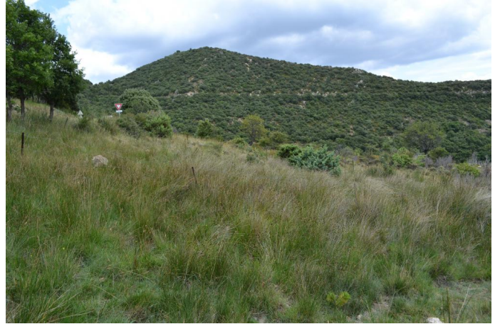
, le 17/07/2017 par Jérémy Cuvelier.