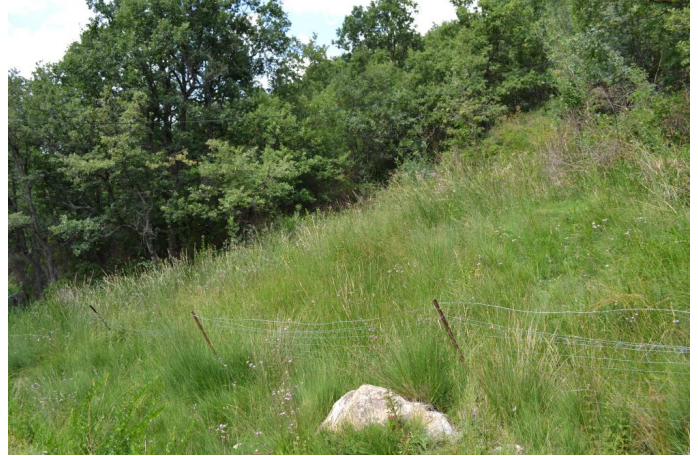
, le 17/07/2017 par Jérémy Cuvelier.