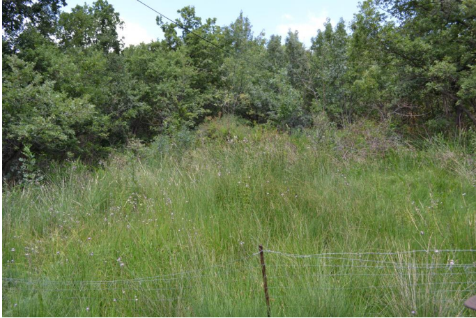
Zone humide de pente dominée par le Choin noir, le Cirse de Montpellier et l'Eupatoire chanvrine, le 17/07/2017 par Jérémy Cuvelier.