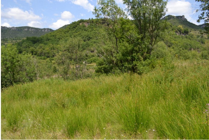
Zone humide de pente dominée par le Choin noir et le Scirpe, le 20/07/2017 par Jérémy Cuvelier.