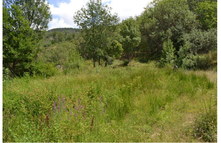
, le 17/07/2017 par Jérémy Cuvelier.