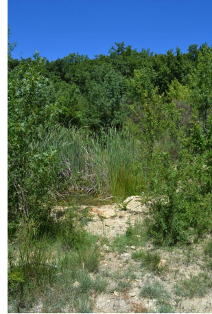
, le 05/07/2017 par JérémY Cuvelier.