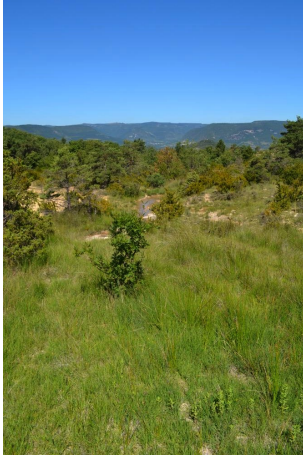
Zone humide de pente à Choin noir, le 05/07/2017 par Jérémy Cuvelier.