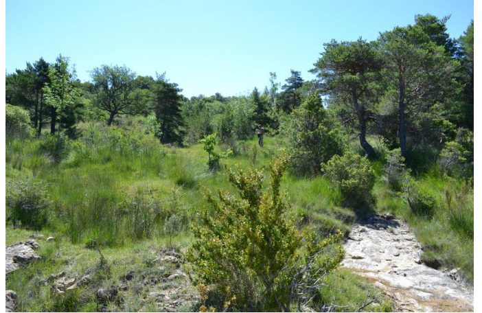
, le 05/07/2017 par Jérémy Cuvelier.