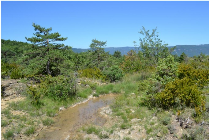
, le 05/07/2017 par Jérémy Cuvelier.