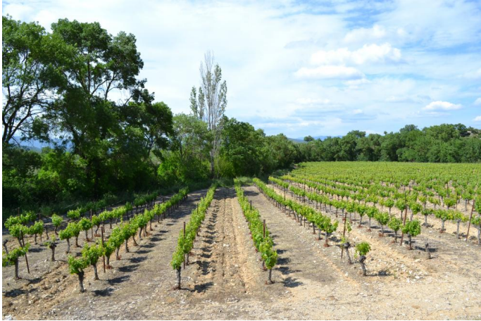
En aval du Mas-de-Londres, le 17/05/2017.