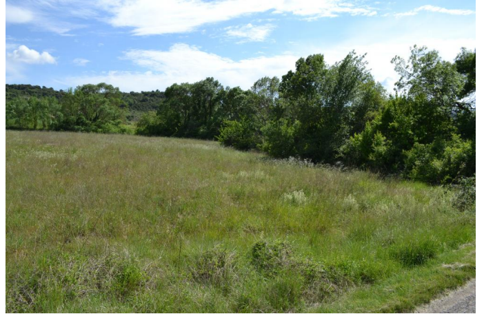
, le 17/05/2017 par Jérémy Cuvelier.