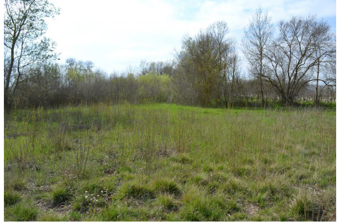
Reconquête d'une friche post-culturelle par les Peupliers et les Frênes vers la Gaufrèze, le 14/03/2017 par JérémY Cuvelier.