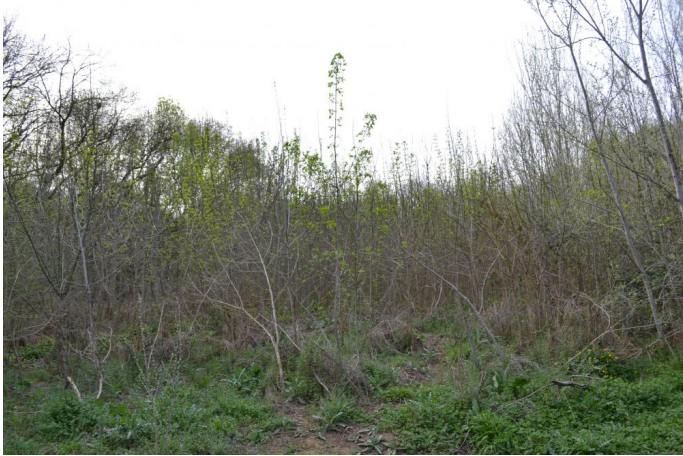
Reconquête d'une friche post-culturelle par les Frênes vers Valensac, le 14/03/2017 par JérémY Cuvelier.