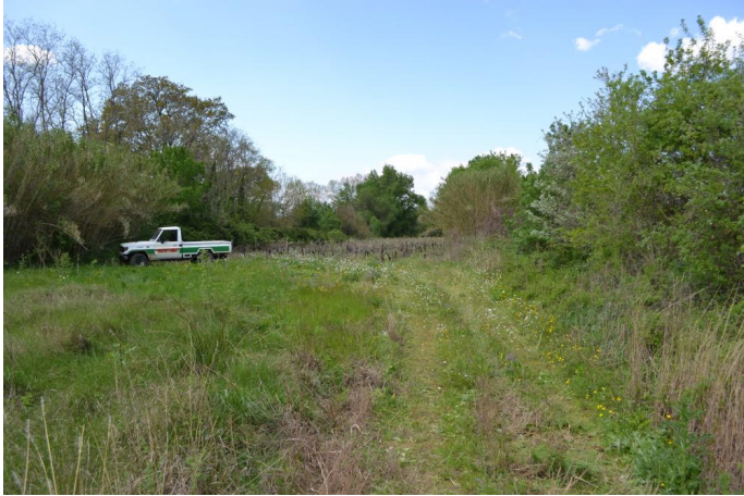
Vers Padère, le 05/04/2017 par Jérémy Cuvelier.