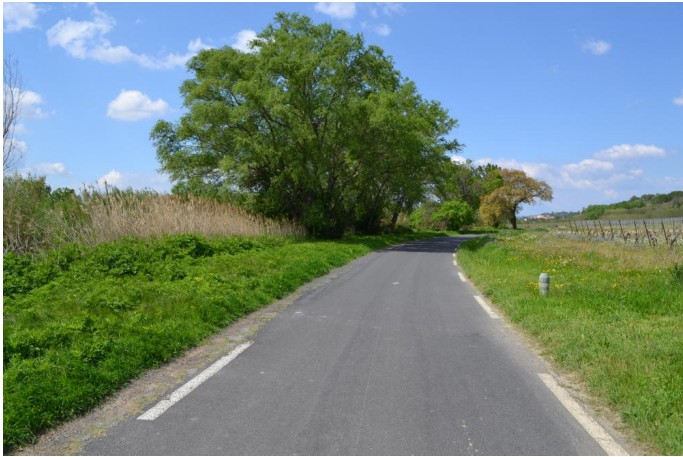
Ripisylve continue le long de la RD146E2, le 05/04/2017 par Jérémy Cuvelier.