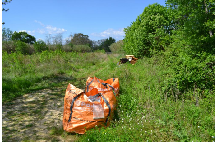
Dépôt de déchets inertes de chantier à proximité du cours d'eau, le 05/04/2017.