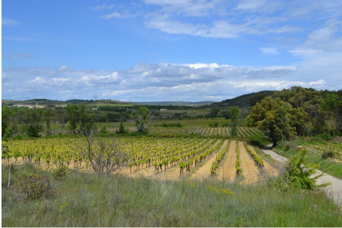
Vers Mourre Sec, le 03/05/2017 par Jérémy Cuvelier.