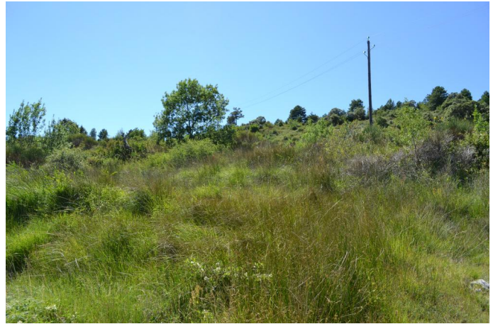
Suintements sur marnes dominés par le Choin noir, le 05/07/2017 par Jérémy Cuvelier.