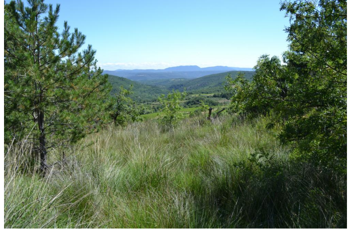
Prairie dominée par le Choin noir, le 05/07/2017 par Jérémy Cuvelier.