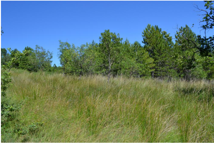
, le 05/07/2017 par Jérémy Cuvelier.