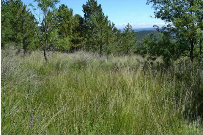
Vers las Fonts des Ouns, le 05/07/2017 par Jérémy Cuvelier.