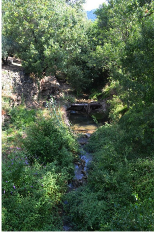
Vers les Salces, le 20/07/2017 par Jérémy Cuvelier.