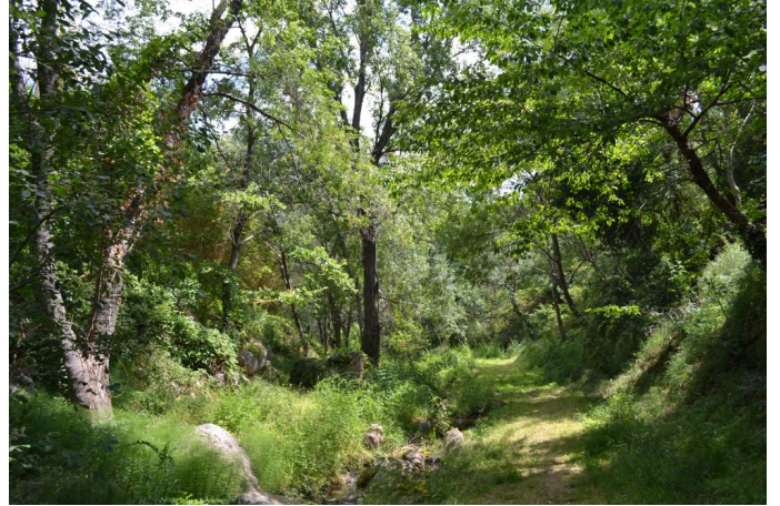
, le 20/07/2017 par Jérémy Cuvelier.