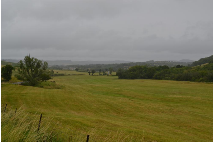
Vers les Sièges, le 28/06/2017 par Jérémy Cuvelier.