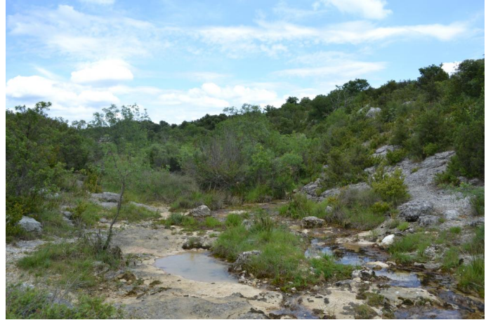
Lit mineur avec vasques en eau et ripisylve éparses de frênes, le 31/05/2017 par Jérémy Cuvelier.