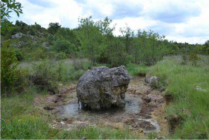
Ripisylve éparses de frênes, le 31/05/2017 par Jérémy Cuvelier.