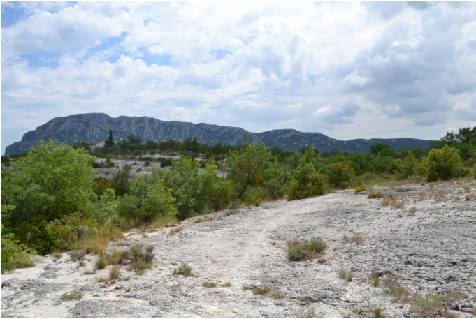
Ripisylve de frênes continue en aval, le 31/05/2017.