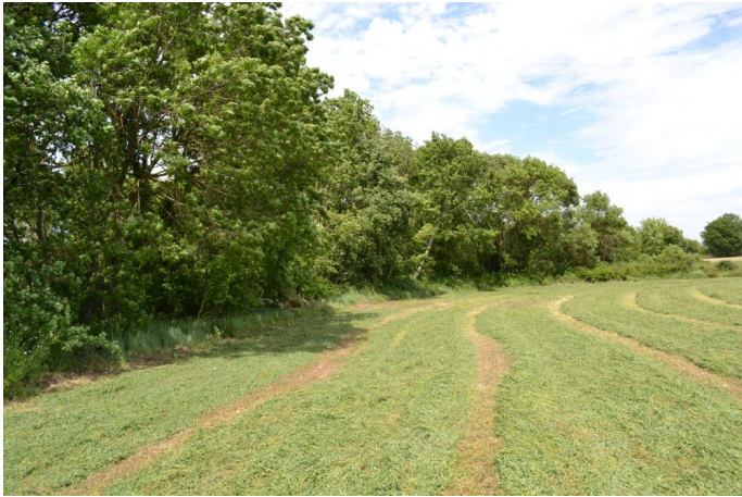
, le 17/05/2017 par Jérémy Cuvelier.