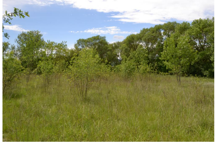
Reconquête d'une friche post-culturale par les Frênes vers la Borie, le 17/05/2017 par Jérémy Cuvelier.