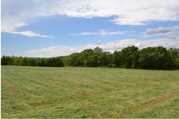
Vers la Borie, le 17/05/2017 par Jérémy Cuvelier.