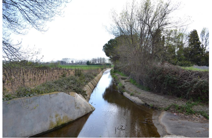
Cours d'eau canalisé et berges bétonnées vers Brignac, le 14/03/2017 par Jérémy Cuvelier.