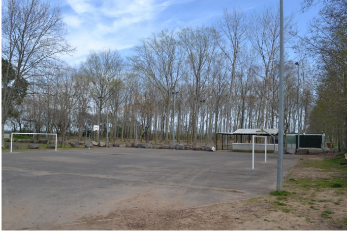
Plantation de Peupliers vers Brignac, le 14/03/2017 par Jérémy Cuvelier.