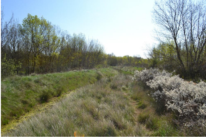
Vers le Castel, le 14/03/2017 par Jérémy Cuvelier.