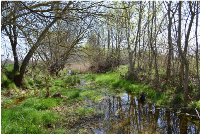
Vers l'Aumède, le 14/03/2017.