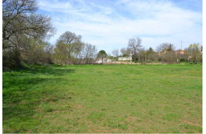
Vers l'Aumède, le 14/03/2017 par Jérémy Cuvelier.