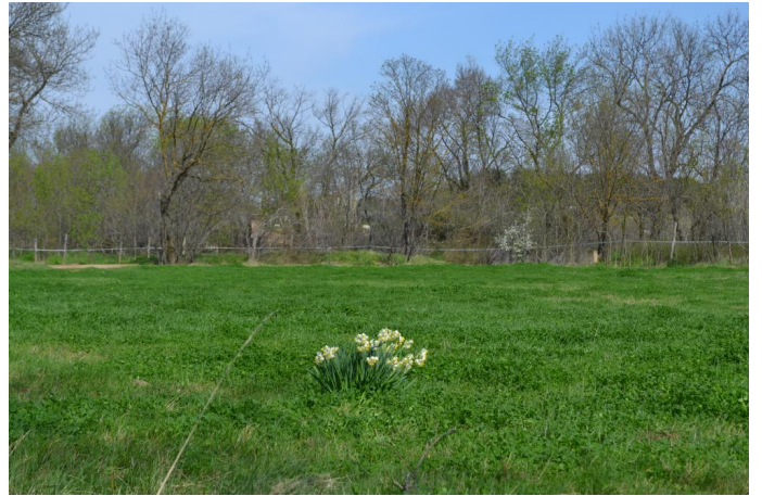
Fasciés des prairies non dominées par des espèces végétales hygrophiles, vers l'Aumède, le 14/03/2017 par Jérémy Cuvelier.