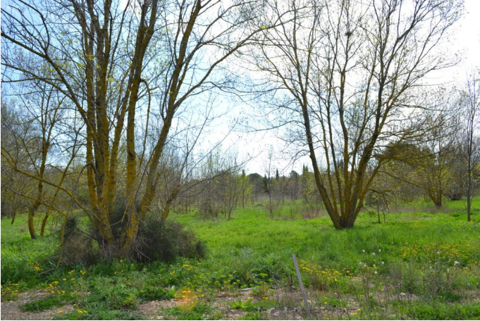
Vers Hortes, le 14/03/2017 par Jérémy Cuvelier.