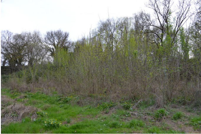
Reconquête d'une friche post-culturelle par les Frênes vers le Concasseur, le 14/03/2017 par Jérémy Cuvelier.