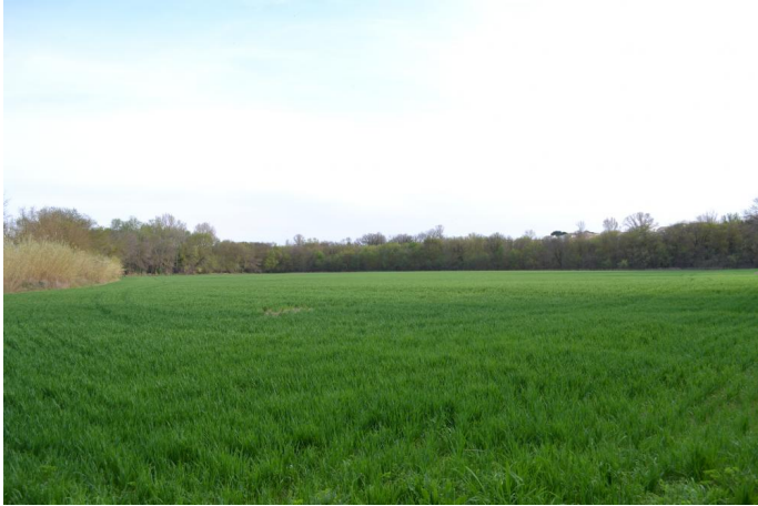
Vers Plaine des Noyers, le 14/03/2017 par Jérémy Cuvelier.