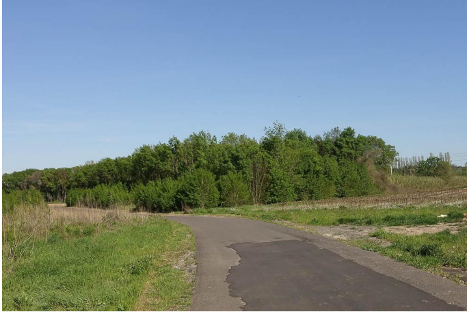
Boisement de Frênes en plaine alluviale., le 30/03/2017 par Jean-Laurent Hentz.