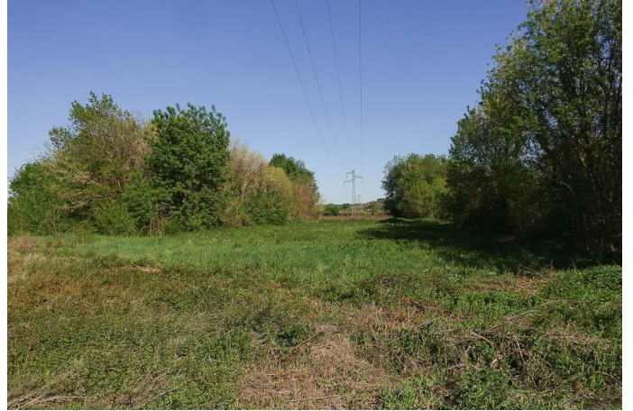
L'entretien sous la ligne HT crée une prairie au potentiel humide., le 30/03/2017 par Jean-Laurent Hentz.