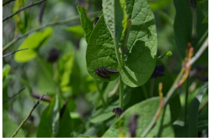
Chenilles de Diane (espèce de papillon protégée au niveau national et européen) sur sa plante hôte Aristolochia rotunda , le 03/05/2017 par Jérémy Cuvelier.