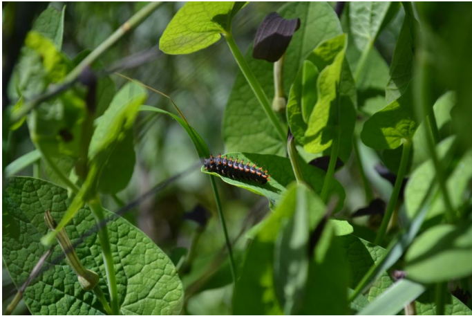
, le 03/05/2017 par Jérémy Cuvelier.