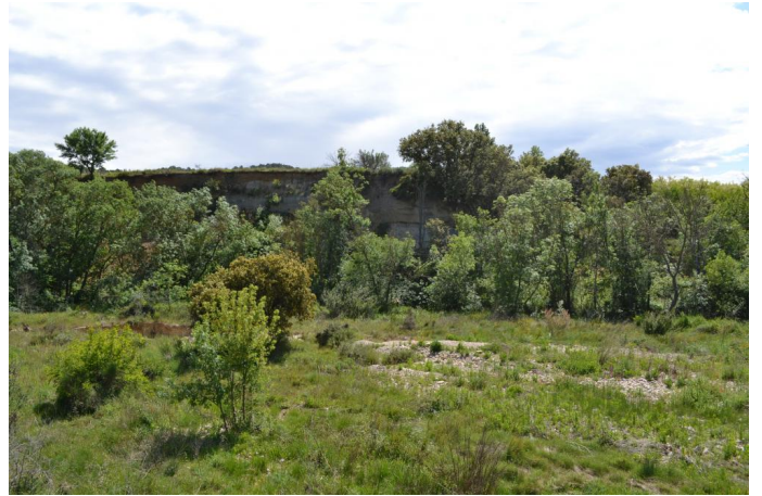
, le 03/05/2017 par Jérémy Cuvelier.