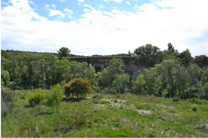
en amont de la RD131, le 03/05/2017 par Jérémy Cuvelier.