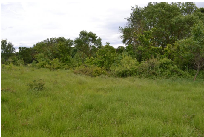
Vers les Barthes, le 03/05/2017 par Jérémy Cuvelier.