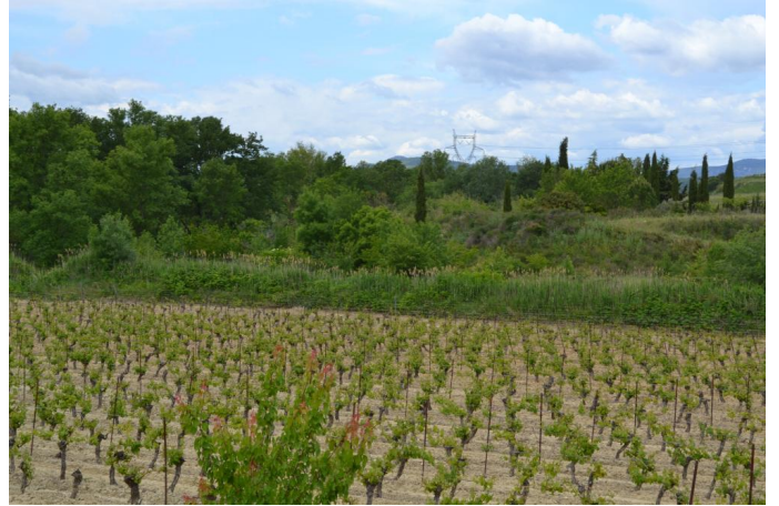
, le 03/05/2017 par Jérémy Cuvelier.