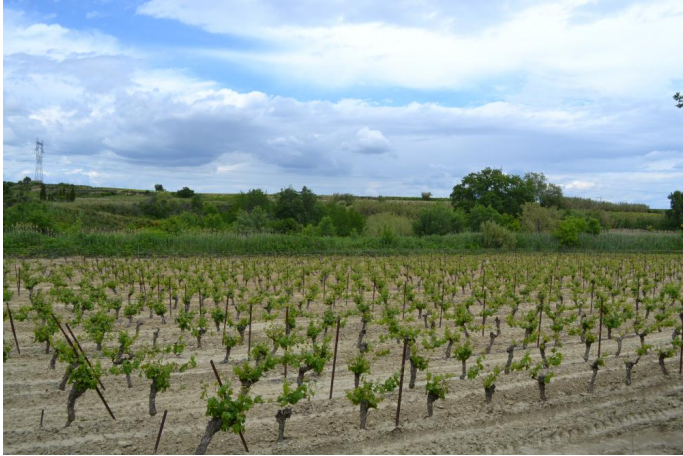
Le Rouviège canalisé en contexte viticole vers les Gardies, le 03/05/2017.