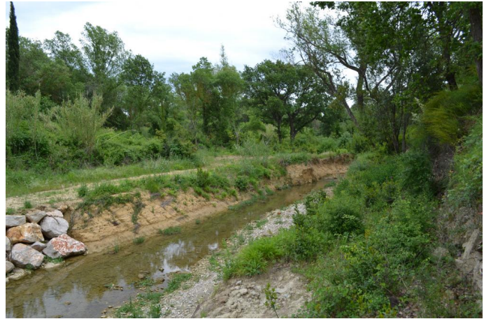
Berges érodées en amont du Mas de Bussac, le 03/05/2017 par Jérémy Cuvelier.