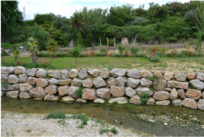
Enrochement vers le Mas de Bussac, le 03/05/2017 par Jérémy Cuvelier.