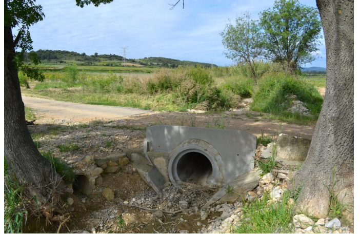
Passage busé sur le ruisseau du Paravel, le 03/05/2017 par Jérémy Cuvelier.