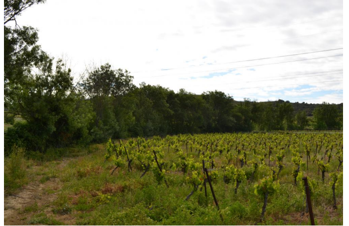
, le 03/05/2017 par Jérémy Cuvelier.