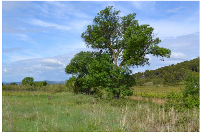
Vers la Marine, le 03/05/2017 par Jérémy Cuvelier.