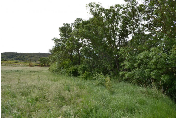
Vers Paravel, le 03/05/2017 par Jérémy Cuvelier.