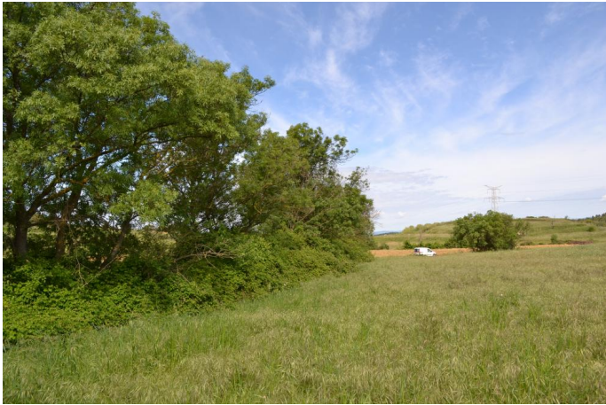
, le 03/05/2017 par Jérémy Cuvelier.