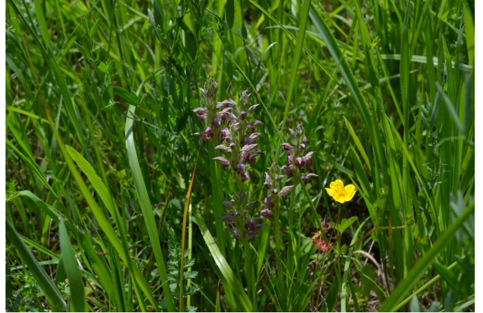
Anacamptis coriophora au sein de la prairie humide, espèce protégée au niveau national, le 17/05/2017 par Jérémy Cuvelier.