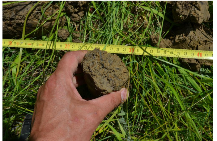
Traces d'hydromorphie (couleur rouille) s'intensifiant en profondeur, caractéristiques des sols hydromorphes, le 17/05/2017 par Jérémy Cuvelier.