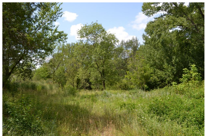
en aval du pont de la RD153, le 20/07/2017 par Jérémy Cuvelier.