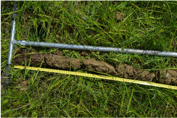
Rédoxisol, sol hydromorphe au niveau de la prairie humide, le 17/05/2017 par Jérémy Cuvelier.