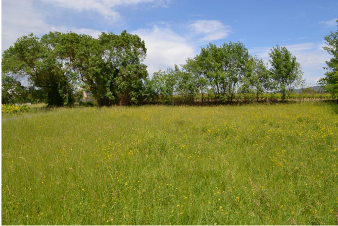
Aperçu de la prairie humide (projet d'urbanisation ?), le 17/05/2017 par Jérémy Cuvelier.