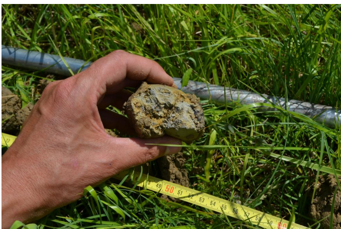
Présence de traits réductiques (gley, couleur grise) à partir de 60 cm, le 17/05/2017 par Jérémy Cuvelier.