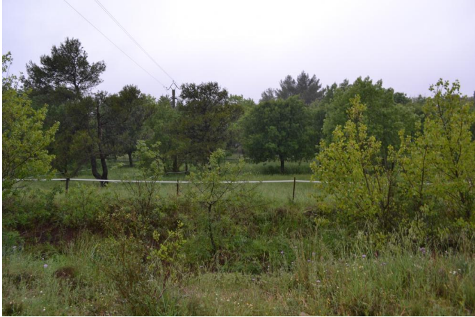
Vers le Frigoulas, le 11/05/2017 par Jérémy Cuvelier.